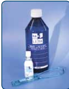
Gorgelmiddel, mondspray en tongreiniger

Reinig uw tong met een tongreiniger. Schraap in ongeveer vijf keer de bacteriën en het slijm van uw tong af. Hoe verder u achter op uw tong komt, hoe meer u kunt weghalen. Reinig uw tong twee keer per dag, het liefst 's ochtends en 's avonds. Onderzoek toont aan dat het reinigen van de tong met een tongreiniger effectiever is dan met een tandenborstel. Levert het tongreinigen onvoldoende resultaat op? Dan is een intensievere verzorging nodig. Soms moet u naast het tongreinigen de bacteriën die uw slechte adem veroorzaken, doden met gorgelmiddelen en/of een mondspray (Halita). Tongreinigers en sprays zijn zonder recept bij uw apotheek verkrijgbaar. Overleg met uw tandarts of mondhygiënist hoe vaak u de tongreiniger of de andere middelen kunt gebruiken.