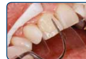
De tandarts brengt de composiet op het oppervlak globaal in vorm

Nadat uw tandarts de composiet op uw tand heeft geplakt, boetseert hij het vulmateriaal eerst globaal in de juiste vorm. De tandarts beschijnt de composiet met een blauw licht als de gewenste vorm is bereikt. Hiermee maakt hij de composiet hard. Ten slotte slijpt hij de composiet in de gewenste vorm en polijst hij het oppervlak. Dan is de facing klaar. Als u de vorm of kleur niet goed vindt, kan uw tandarts de facing, na het wegslijpen van een laagje composiet, direct corrigeren.