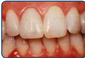
Op de tand is een porseleinen facing geplaatst