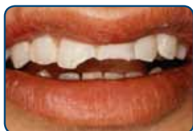
Door een val zijn twee tanden gebroken

Een facing is een laagje tandkleurig vulmateriaal van composiet of een schildje van porselein. De tandarts plakt het vulmateriaal op de tand.