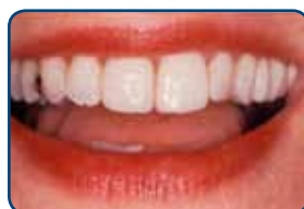
De facing van composiet heeft zowel de kleur als de stand van de tanden verbeterd