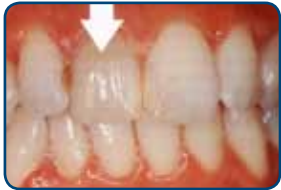
De tand is verkleurd

Tijdens de tweede behandeling brengt de tandarts de facing aan. Voordat de tandarts de facing aan uw tand plakt, behandelt hij uw tand voor met een zuur. Ook brengt hij een hechtlaag aan op uw tand. Op deze laag plakt hij de facing. Als u de vorm of kleur van de facing niet goed vindt, moet een geheel nieuwe facing in het tandtechnisch laboratorium worden gemaakt.