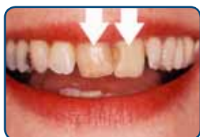
De tanden zijn verkleurd en staan niet mooi op een rij

Een facing gaat vijf tot tien jaar en soms ook langer mee. Roken en veel koffie of thee drinken, werkt verkleuring in de hand. Een facing kan slijten of beschadigen als u bijvoorbeeld tandenknarst of op uw nagels bijt. De tandarts kan een gesleten of beschadigde facing altijd repareren of vervangen. Deze behandeling beschadigt de tand zelf niet.