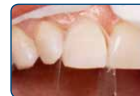
Nadat de ongeslepen tand is voorbehandeld met een zuur ziet het oppervlak er mat uit

Voordat uw tandarts de composiet aan uw tand plakt, behandelt hij uw tand voor met een zuur. Ook brengt hij een hechtlaag aan op uw tand. Op deze laag bevestigt hij de nog zachte composiet.