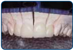
Porseleinen facings op een mal

Uw tandarts maakt een afdruk van uw tand. Die afdruk gaat naar het tandtechnisch laboratorium. Daar maken ze uw facing in de gewenste vorm.