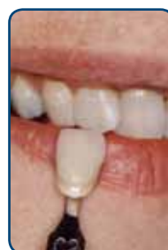
De gewenste kleur bepalen

Eerst kiest de tandarts in overleg met u de juiste kleur van uw facing. Het effect van de gewenste kleur kan de tandarts u direct laten zien. Hij heeft verschillende kleuren tot zijn beschikking die hij met elkaar kan combineren. U kunt het vergelijken met het mengen van verschillende soorten verf.