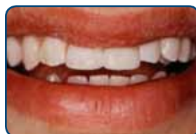
Nog dezelfde dag zijn de tanden met composiet hersteld