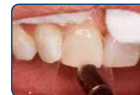
De hechtlaag is aangebracht