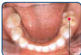
Kaaskies in het melkgebit

Kinderen met kaaskiezen hebben meer gaatjes dan leeftijdsgenoten zonder kaaskiezen. Heeft een kind kaaskiezen in zijn melkgebit? Dan heeft het een grotere kans op de ontwikkeling van kaaskiezen in zijn blijvend gebit. In Nederland heeft 5-9% van de kinderen kaaskiezen in het melkgebit. In het blijvend gebit heeft 9-14% van de kinderen één of meerdere kaaskiezen. Kinderen met kaaskiezen in het blijvend gebit, hebben ook kans op een wit-gele verkleuring van de blijvende voortanden.