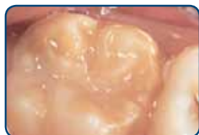
Kaaskies in het blijvend gebit