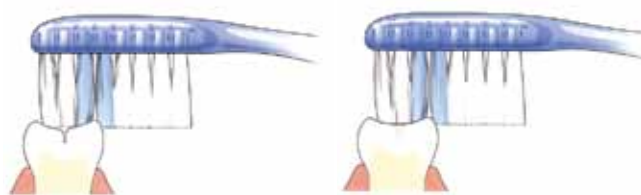
Tandenborstel komt niet in de groef

Kiezen hebben veel groefjes op het kauwvlak. Daarin ontstaat makkelijk tandplak. Niet regelmatig verwijderde tandplak kan gaatjes veroorzaken. Goed poetsen dus! Als de tandarts of mondhygiënist ziet dat er in het kauwvlak een gaatje ontstaat, kan hij besluiten een laagje aan te brengen. Dit heet sealen. Diepe groeven kan hij door het sealen afdichten. Alleen de blijvende kiezen komen normaal gesproken in aanmerking om te sealen. Dit gebeurt meestal kort nadat ze helemaal zijn doorgebroken. Ook gesealde kiezen moet je goed poetsen.