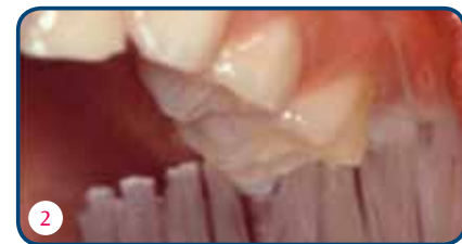
Als je de tanden in de lengterichting poetst, sla je de nieuwe blijvende kies die doorbreekt over (foto 1). Juist de nieuwe kiezen zijn extra kwetsbaar. Zet de tandenborstel daar dwars op de tandenrij (foto 2).

Als nieuwe kiezen doorkomen, zwelt vaak het tandvlees op. Dat is normaal. Het kan pijn doen, maar je hoeft niet ongerust te zijn.