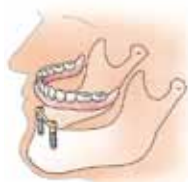
Twee met elkaar verbonden implantaten dienen als verankering voor de overkappingsprothese

Dan kan op implantaten (meestal twee) een overkappingsprothese worden geplaatst. Deze wordt op de implantaten vastgeklemt.